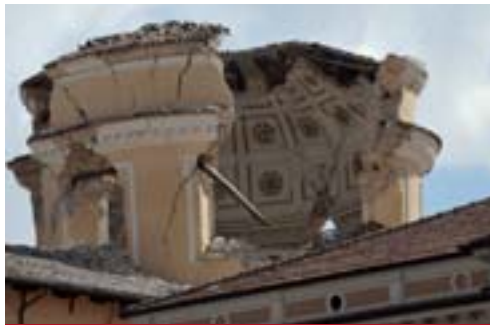
La cupola gravemente danneggiata, e non ancora ristrutturata, della chiesa delle Anime Sante in piazza del Duomo